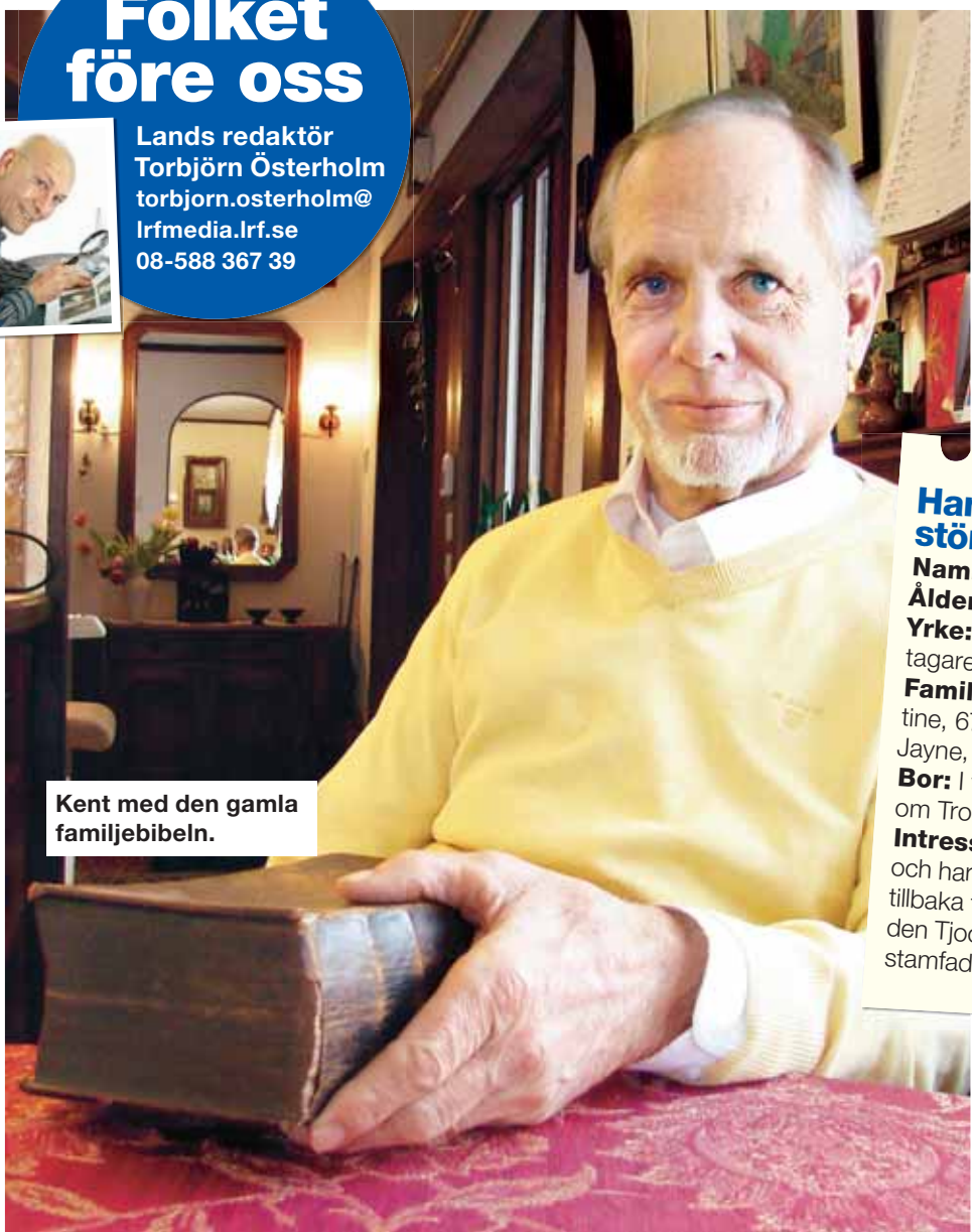
Kent med den gamla familjebibeln.